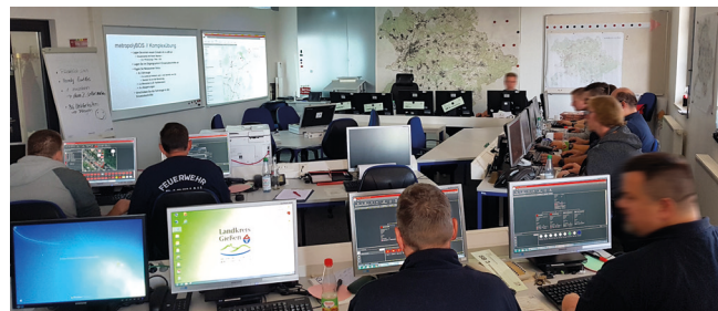
Multiplikatorenschulung im Landkreis Gießen.

In der internen Multiplikatorenschulung wurden einzelne Themenblöcke mit Hilfe einer Präsentation zunächst theoretisch vermittelt. Eine zeitgleiche Anwendung der Programme durch die Teilnehmer war in dieser Phase noch nicht vorgesehen, Fragen jedoch selbstverständlich gestattet. Jeweils nach Beendigung