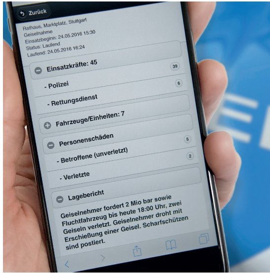
Abb. 3: Mobiler Zugriff auf Einsatzinformationen mit dem Smartphone

kräften vor die Medien tritt und sich diese nicht innerhalb von Minuten drastisch ändern – sofern dies nicht dem tatsächlichen Einsatzgeschehen entspricht. Bundesländer wie Baden-Württemberg mit dem „InterConnect Server“ für eine landesweite Datenpyramide oder Nordrhein-Westfalen mit dem Projekt VIDaL (Vernetzung von Informationen zur Darstellung der Landeslage) arbeiten an entsprechenden, mandantenfähigen Plattformen zur Lösung dieser Probleme.