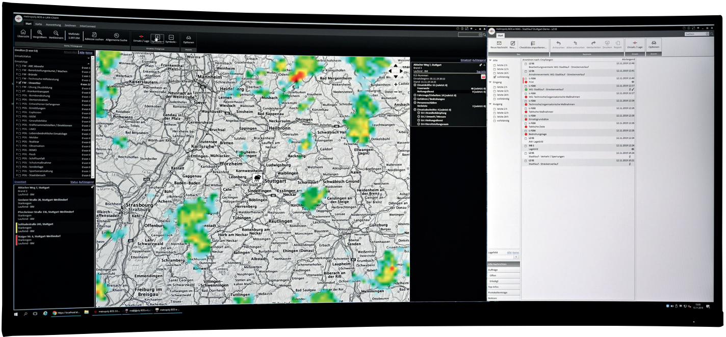
Abb. 1: Lageübersicht mit DWD-Wetterdaten